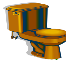
ECO FOSA SK-3